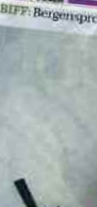
13. APRIL 2017