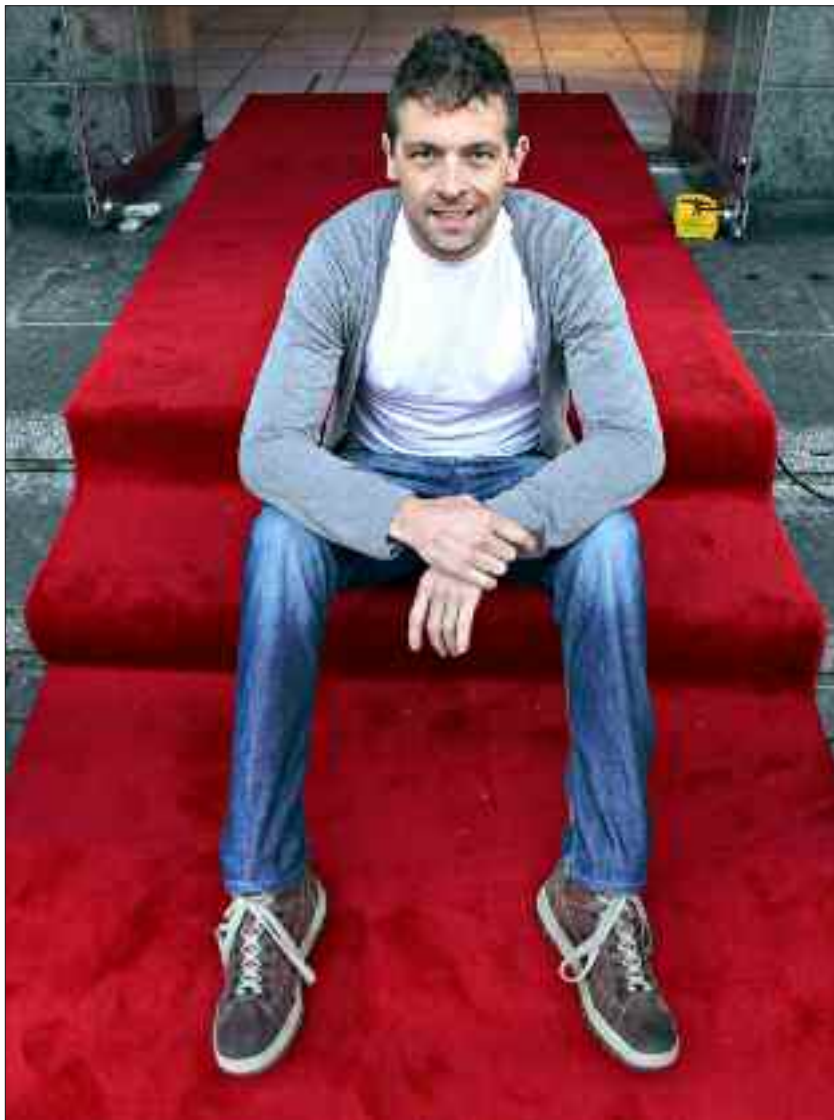
FILMAR I NORD-TRØNDELAG: – Eg trur ikkje mannen i gata her i Noreg har høyrte om han, men i Tyskland er det slik. Det blir eit fint høve for det norske publikummet til å bli kjent med ein dyktig tysk skodespelar, seier regissør Bobbie Peers om filmstjerna han har hanka inn. Innspeinga startar i Grong i Nord-Trøndelag tidleg neste år, om alt går etter planen.

Sparebanken Vest, Bergen kommune, Hordaland fylkeskommune og Kulturdepartementet. Dei nærare to millionane har gått til fjorten ulike prosjekt.