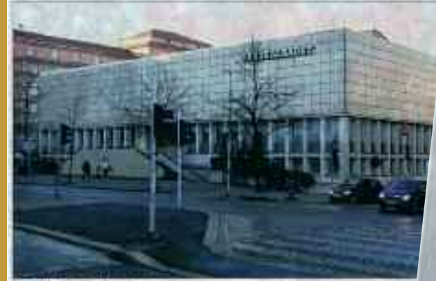
BERGHEIT LØVSTAM: 13. APRIL 2017

Servert: 13. APRIL 2017 Tilstanden på verdensmarkedet for filmhus er fortsatt god. I Bergen er det allerede blitt etablert et nytt filmhus, og det er allerede blitt etablert et nytt filmhus, og det er allerede blitt etablert et nytt filmhus.