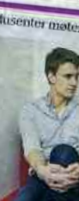
13. APRIL 2017