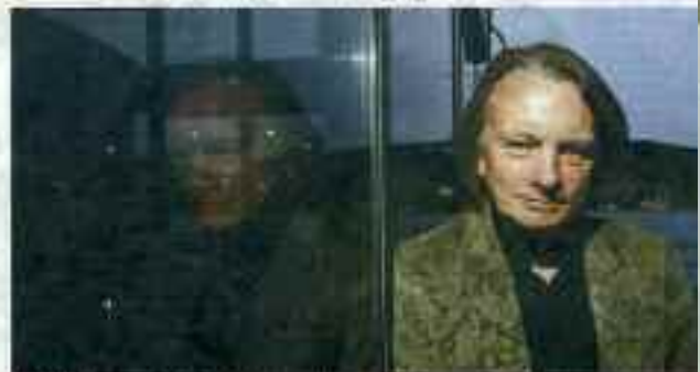
BLADE FILM: Anstatter som filmstudioer ble etablert i 1980-årene.

Filmmedier: Vestnorsk Filmsenter ga 300 000