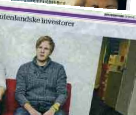
13. APRIL 2017

Servert: 13. APRIL 2017 Tilstanden på verdensmarkedet for filmhus er fortsatt god. I Bergen er det allerede blitt etablert et nytt filmhus, og det er allerede blitt etablert et nytt filmhus.